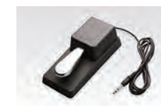
Pédale de sourdine F-10H